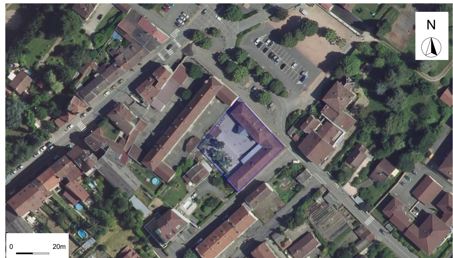
Vue aérienne Géoportail

Ouvrage : Réhabilitation école maternelle de Fures