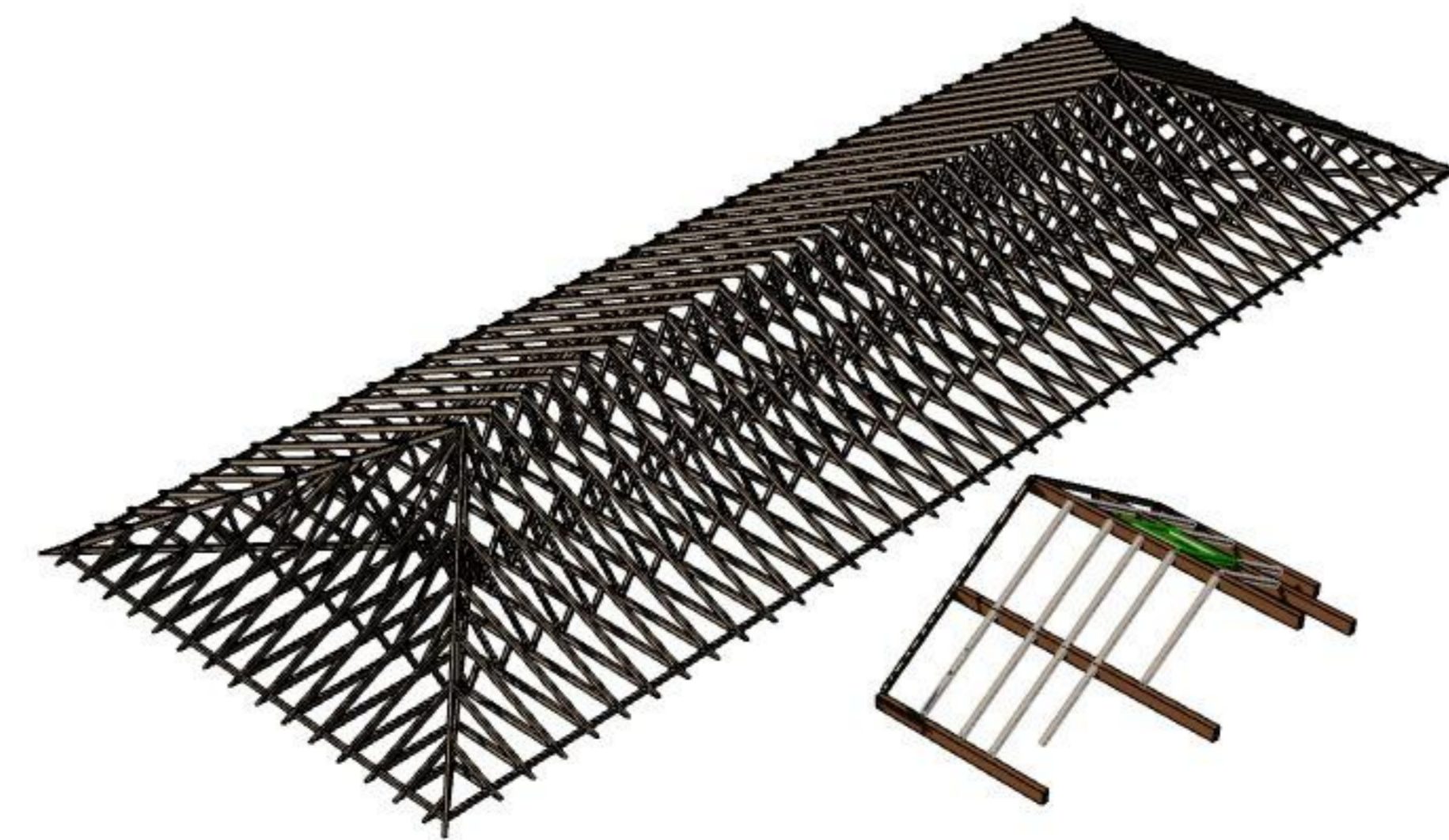
IDONEIS Perspective Charpente