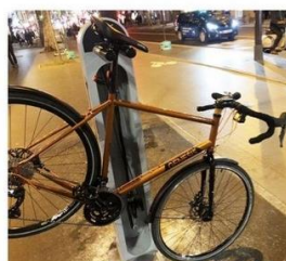
Station de réparation avec support d'accroche pour réparer facilement toutes les parties d'un vélo.