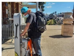
Station de gonflage sans électricité utilisable pour vélos, poussettes, fauteuils roulants... Pompe à bras et tuyau tressé métallique avec tête de gonflage universelle.