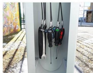
Outils en libre-service reliés à la base par des câbles en acier. Le strict nécessaire pour des réparations de base (clés, tournevis, démonte-pneu...).