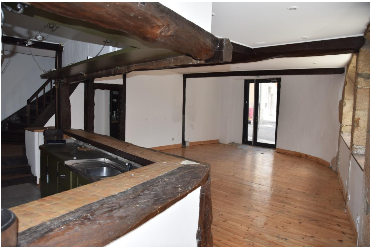
Photos avant travaux. Des modifications seront apportées (notamment suppression de l'accès aux étages par l'escalier).